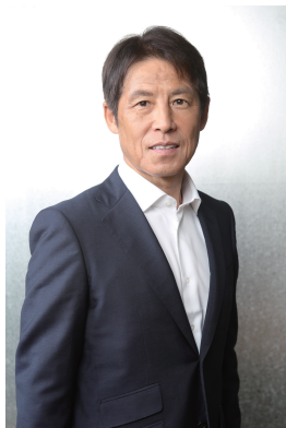
西野 朗 NISHINO Akira